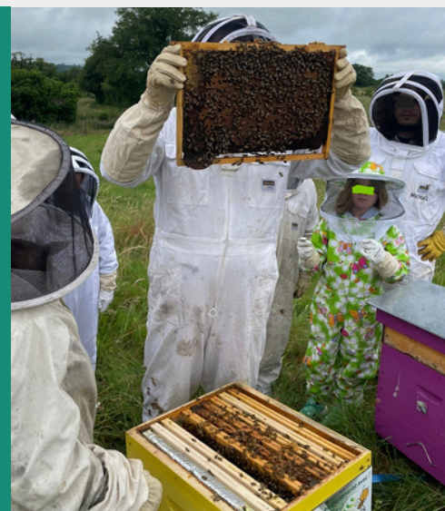
Journée découverte en famille des Ruches IZARET organisée par notre alternante communication.

Un grand merci à nos tuteurs et aux équipes pour la transmission et leur accompagnement au quotidien.